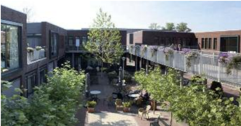
Das Wohnquartier »De Hogeweyk«

Wie können schwer gerontopsychiatrisch erkrankte Menschen ein Leben in Normalität führen? Ein Modellprojekt weist einen Weg. Der Geschäftsbereich Graf Recke Wohnen & Pflege hat sich aufgemacht, diese Vision auf seinem Areal in Hilden zu verwirklichen.